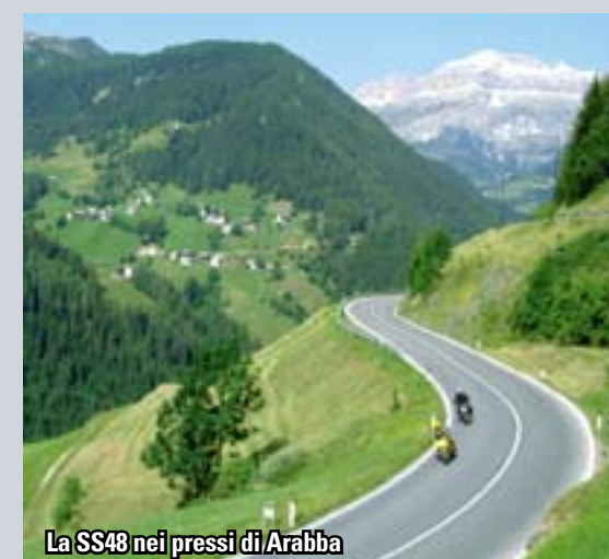
La SS48 nei pressi di Arabba