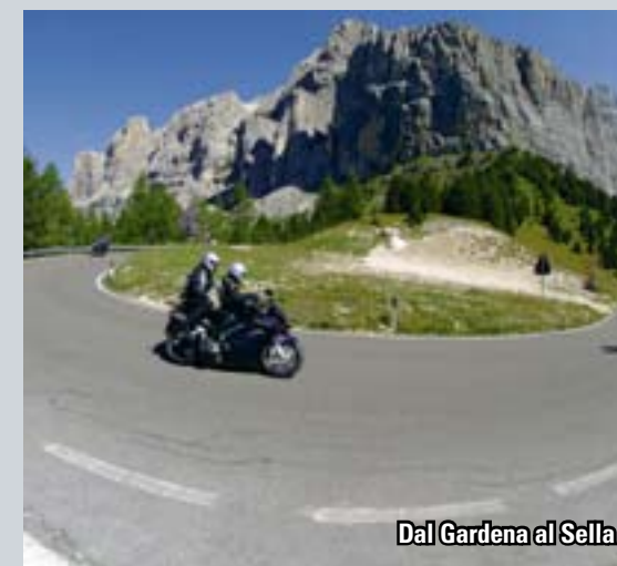
Dal Gardena al Sella

I passi meno frequentati sono quelli che hanno un manto stradale più "performante", oltre a essere quelli più divertenti, anche se in generale le condizioni del fondo sono sempre buone. Le maggiori attenzioni vanno prestate al traffico che su alcuni valichi e in alcune zone, soprattutto durante la bella stagione, può diventare anche intensissimo.