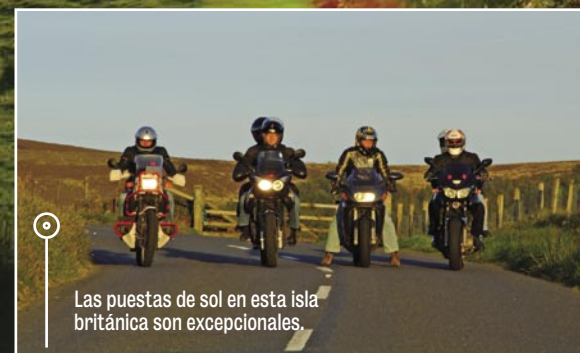
Las puestas de sol en esta isla británica son excepcionales.

A los humos del escape (pocos) y los palacios de estilo victoriano, se sustituyen el perfume del campo, con verdes deslumbrantes y muros de piedra. Pasamos alrededor del Fairy Bridge, donde no hay que olvidarse de saludar al simpático duende, que dicen que trae suerte no sólo a los participantes de la